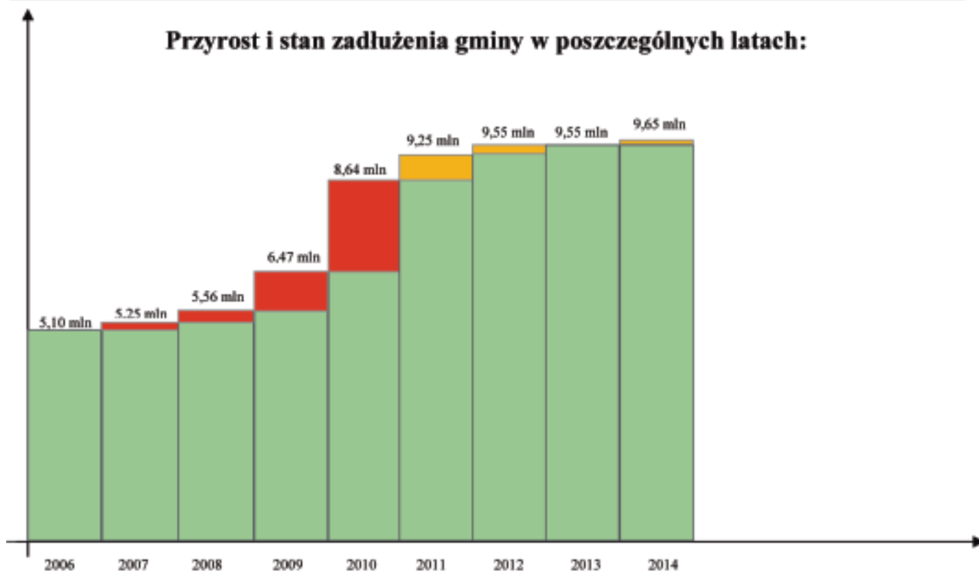
Przyrost i stan zadłużenia gminy w poszczególnych latach: