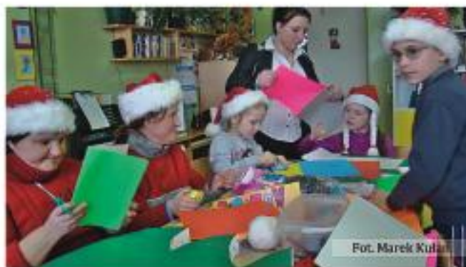
Fot. Marek Kułan

Organizatorzy imprezy „Witaj Św. Mikołaju” składają także serdeczne podziękowania: