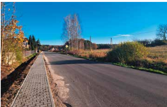
Droga przez Pierzchniankę