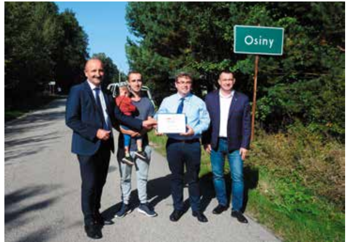
Droga w Osinach

We wrześniu udało się pozyskać od Wojewody z Rządowego Funduszu Rozwoju Dróg - dotację w kwocie