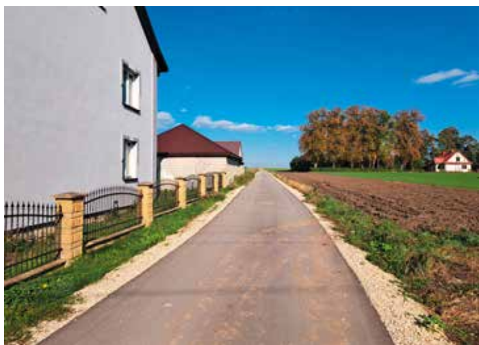
2. Droga Podstoła Parcela – 200 mb