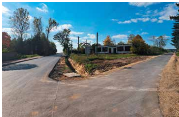
5. Droga przez Osiny-Lizawy II etap – 700 mb