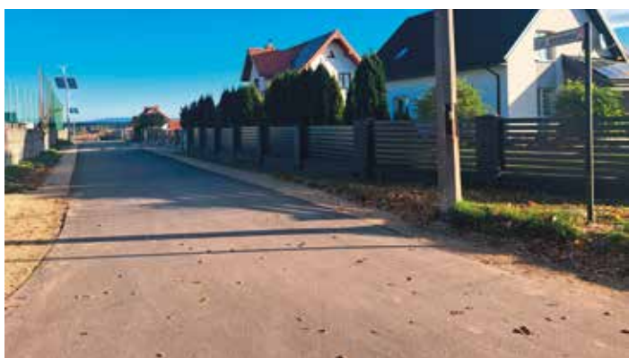
7. Ulica Jesionowa w Pierzchnicy – 200 mb