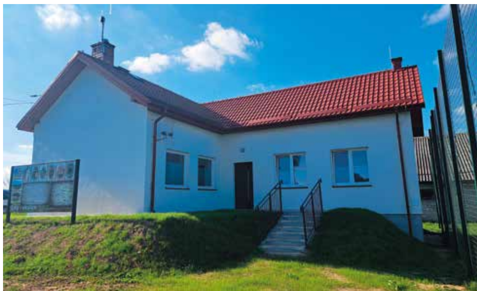
Świetlica w Ujnach