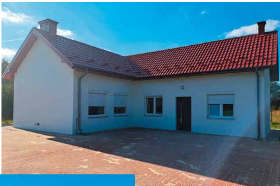
Świetlica w Podlesiu

Złożony jest ponadto wniosek do komisarza wyborczego w Kielcach o utworzenie lokalu wyborczego