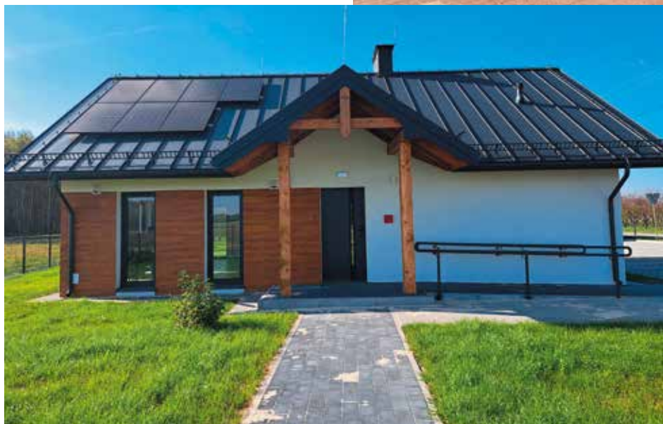
Świetlica w Straszniowie Gumienickim