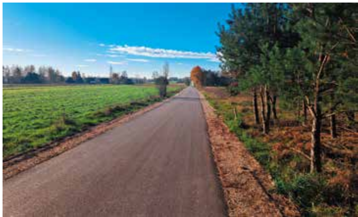
6. Droga Skrzelczyce-Komórki – 1 km