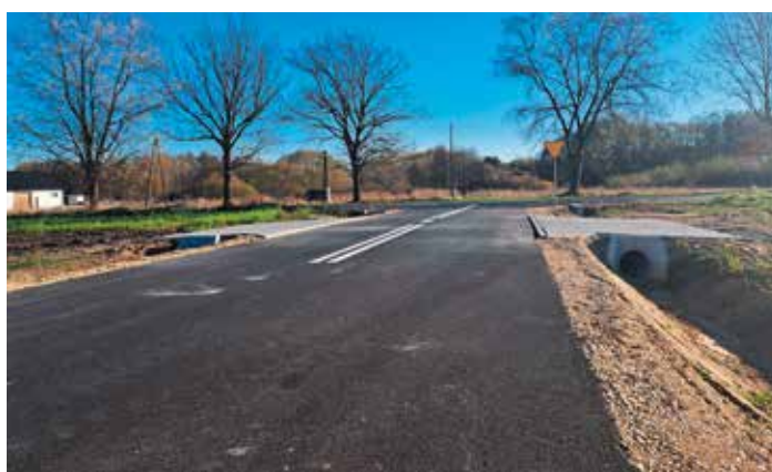
8. Droga do terenów inwestycyjnych w Pierzchnicy – 50 mb