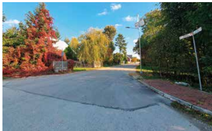
4. Droga Drugnia-Drugnia Rządowa – 300 mb