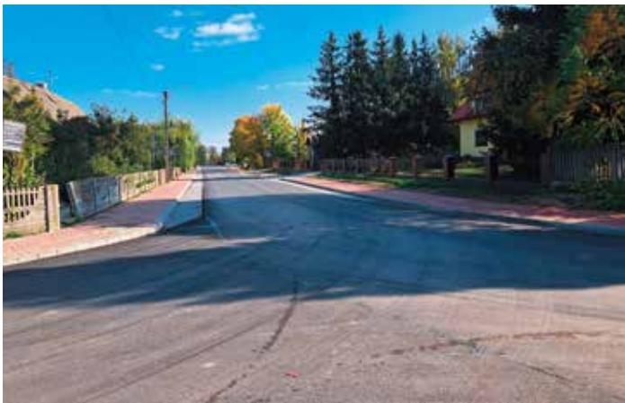
Droga przez Drugnię