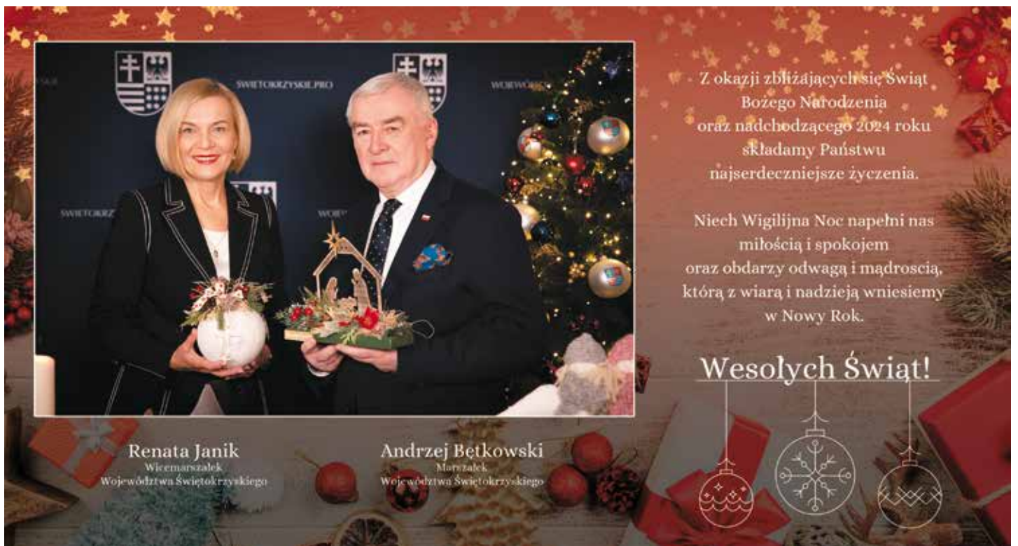
Renata Janik Wicemarszałek Województwa Świętokrzyskiego