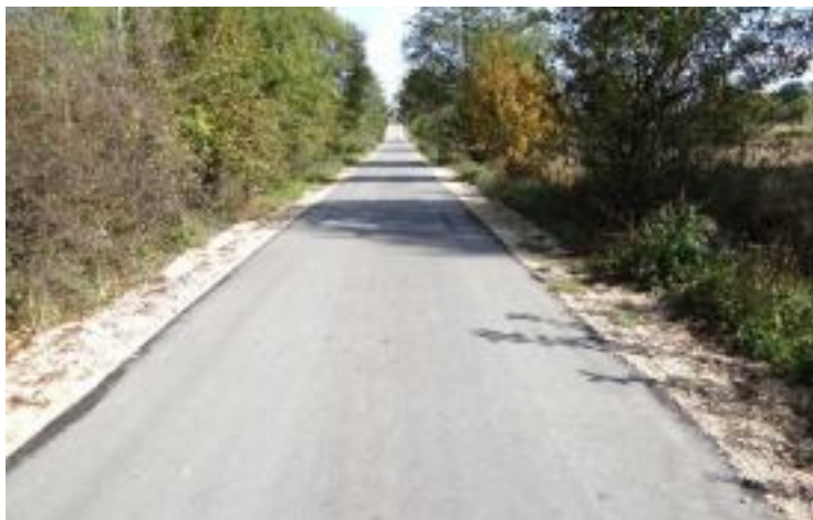
W Osinach wykonano nawierzchnię asfaltową w kierunku Lizaw.