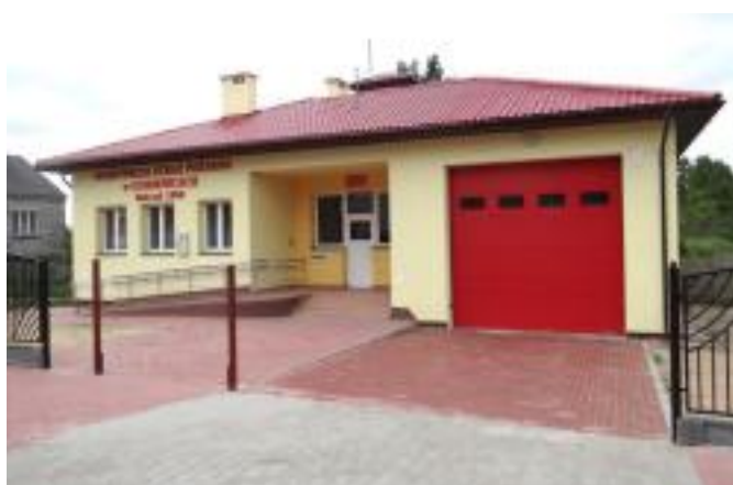
Nowy garaż w Gumienicach współfinansowany przez Wspólnotę Gruntową w Gumienicach.