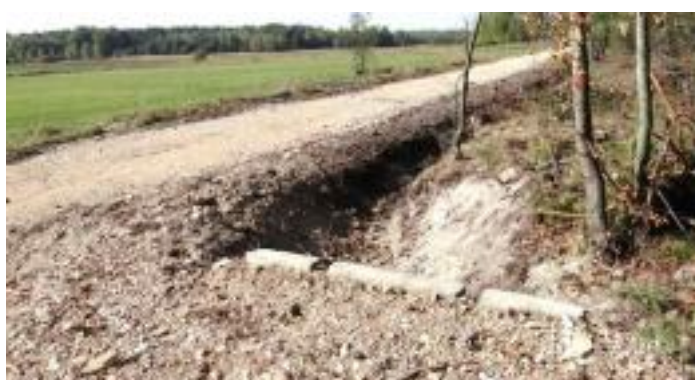
Zmodernizowano drogi w kruszywie w następujących przysiółkach: Podstoła Żabieniec, Drugnia Parcela, Osiny Lizawy, Holendry Leonów, Górki Podgrzywie, Skrzelczyce Dąbrowa, Czarna i inne.

Łącznie wywieziono około 10 000 ton kruszywa.