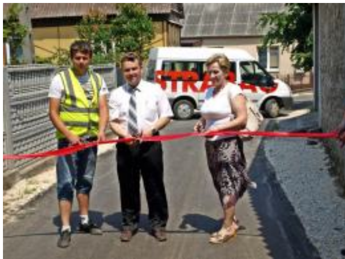
W Pierzchnicy wykonano nawierzchnię asfaltową ulic: Błońska, Krótka, Dąbie, Św. Anny, Mrowia.