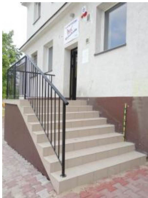
W Skrzelczycach – Klub Młodzieżowy Wolna Strefa