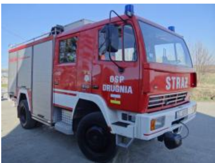
Zakupiono samochód dla OSP Drugnia.