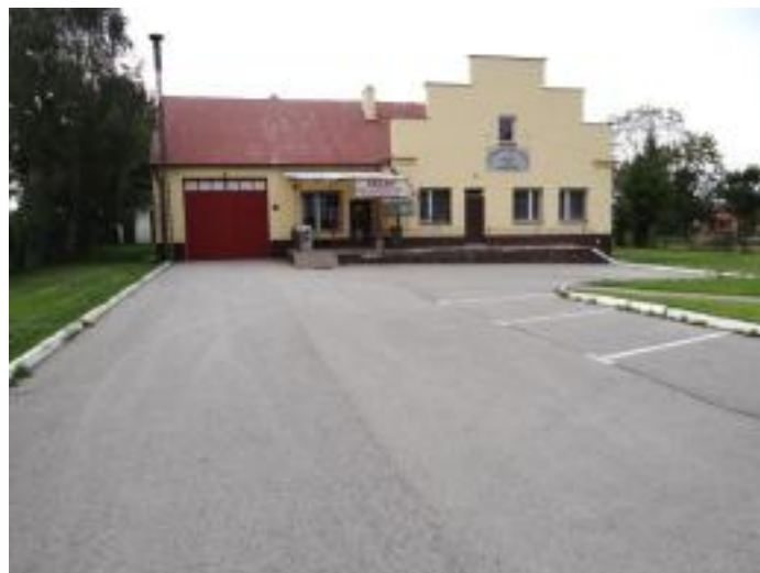
Nowy plac manewrowy w Skrzelczycach i odnowiona remiza.