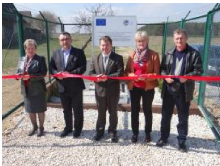
Otwarcie kanalizacji w Pierzchniance – etap I.