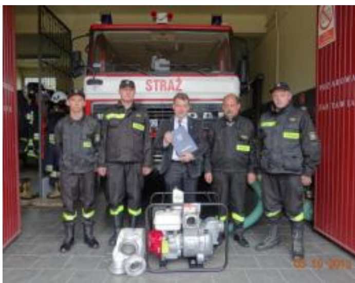
-OSP Pierzchnica i