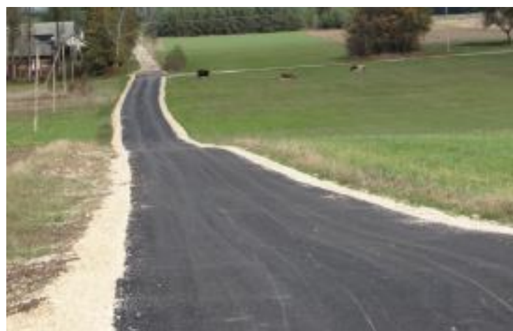
W Skrzelczycach wykonano nawierzchnię asfaltową w przysiółkach: Góra, Hebdzie, Zalaski, Obrabianka, Przez Górkę.