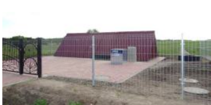
Kanalizacja i oczyszczalnia ścieków w Skrzelczycach.