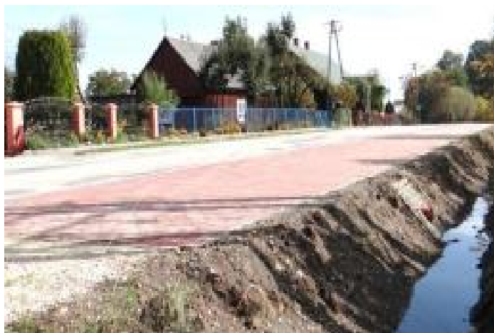
W Drugni wspólnie z Powiatem.