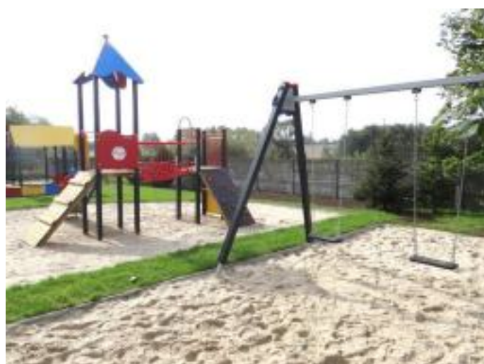
Nowe place zabaw przy przedszkolu w Pierzchnicy.