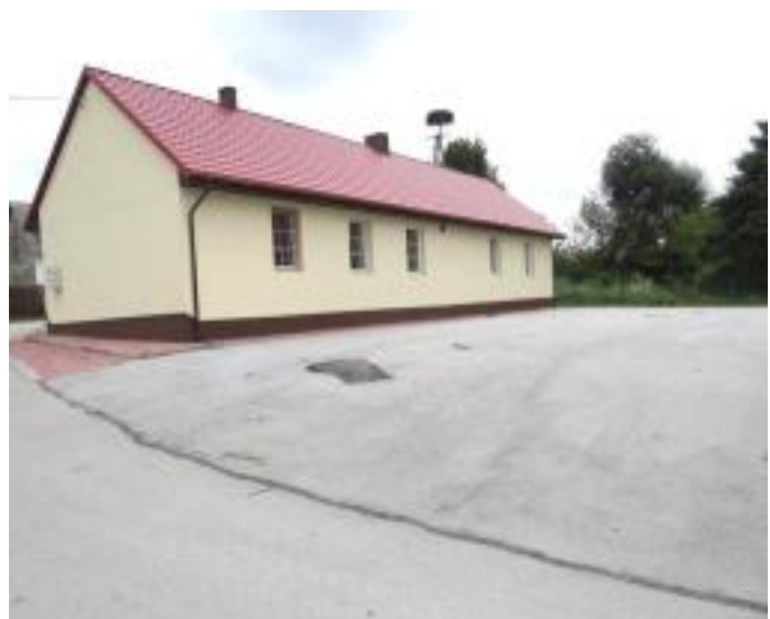
Nowy plac manewrowy i odnowiona remiza w Maleszowej.