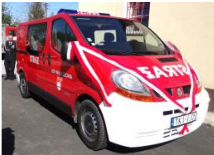
Zakupiono samochód dla OSP Maleszowa.