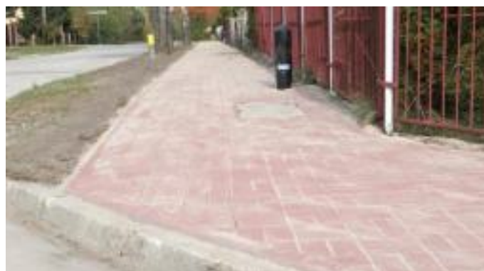
W Pierzchnicy: ul. Szkolna, ul. Mickiewicza, ul. Jana Pawła II, ul. Żeromskiego, uliczka.