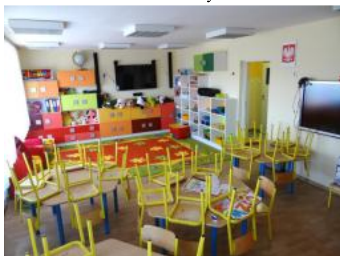
Zakupiono nowoczesne wyposażenie oddziałów przedszkolnych w Pierzchnicy.