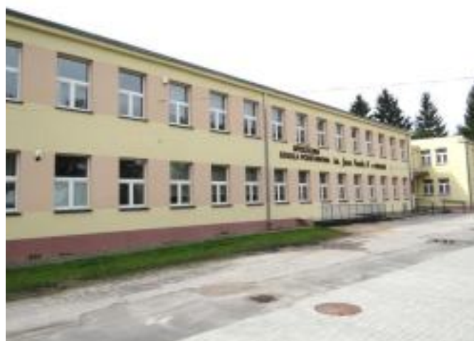
Odnowiona elewacja obiektu szkolnego w Drugni.