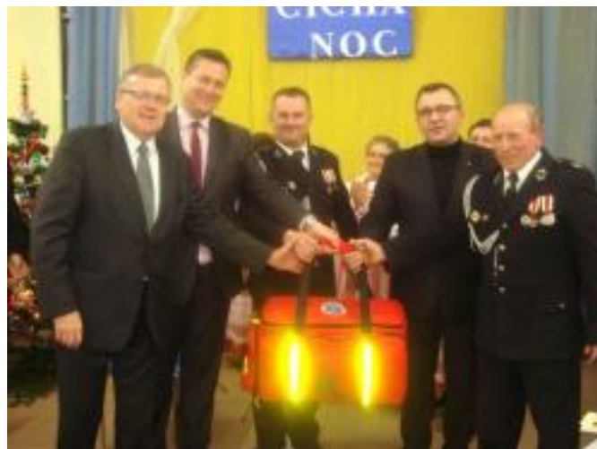
- OSP Gumienice.