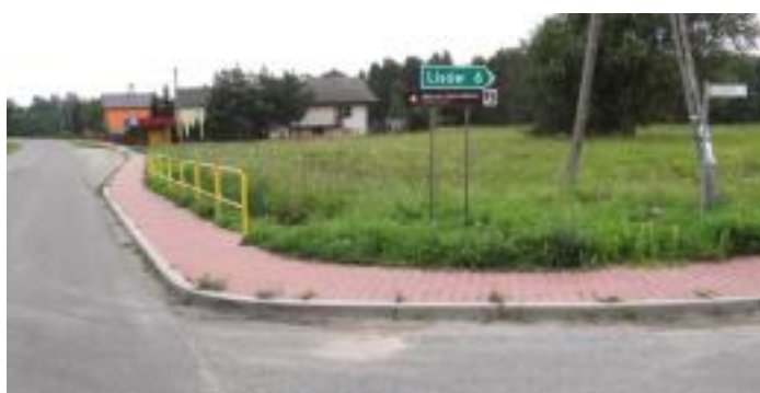
W Gumienicach (wspólnie z Powiatem) przy remizie oraz na tzw. „Szosie”.