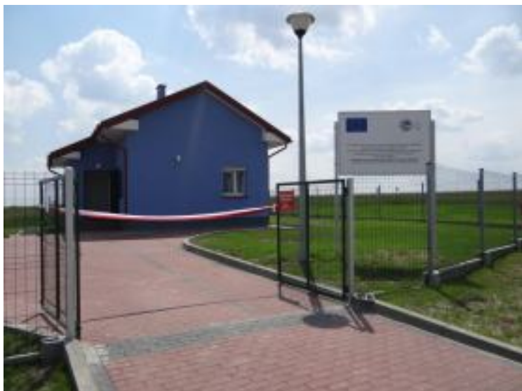
Nowa przepompownia zapewnia dostawę wody dla całej Gminy Pierzchnica.