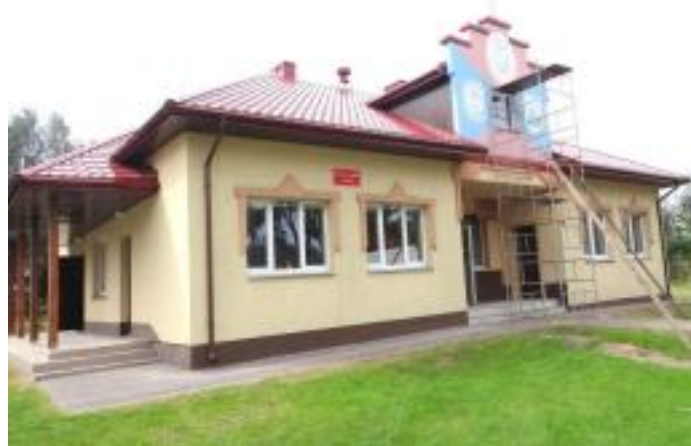
Nowy dach na remizie w Drugni.