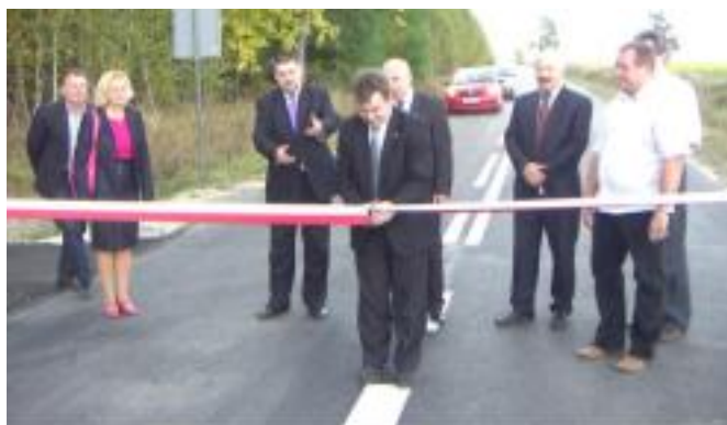
Przebudowa (wspólnie z Powiatem) drogi przelotowej przez Pierzchnicę wraz z chodnikiem na ul. Kieleckiej i Kościelnej.