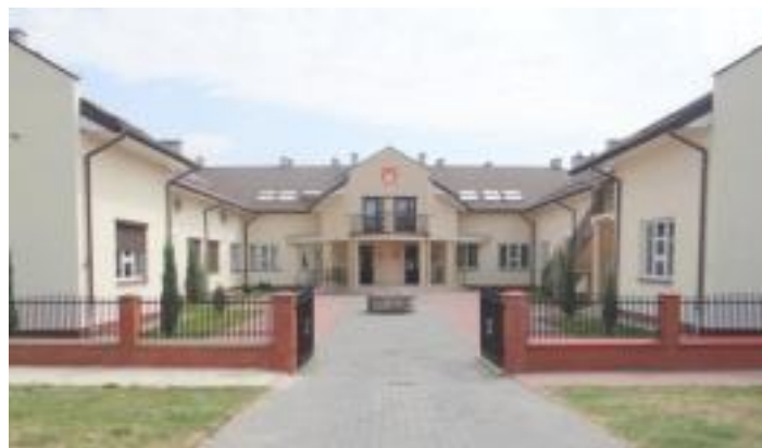
Odnowiona elewacja obiektu szkolnego w Pierzchnicy.