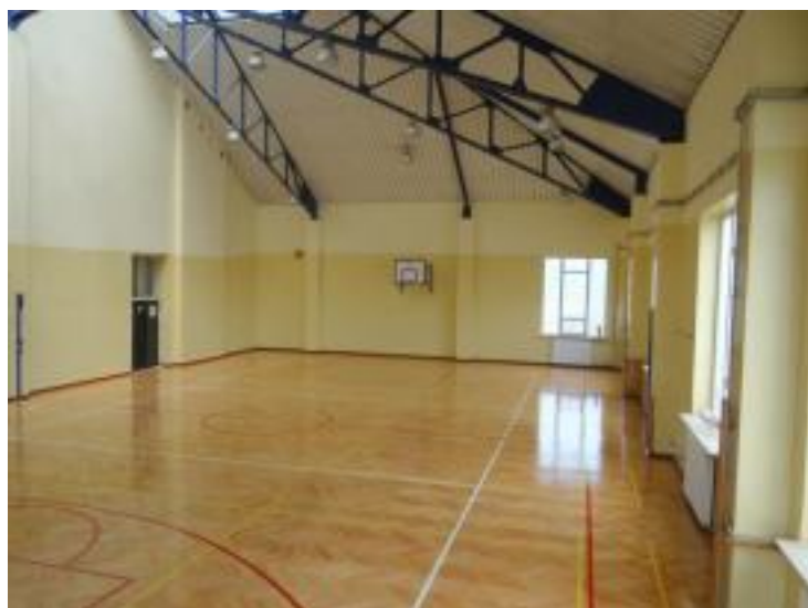
Odnowiona została sala gimnastyczna w Pierzchnicy.