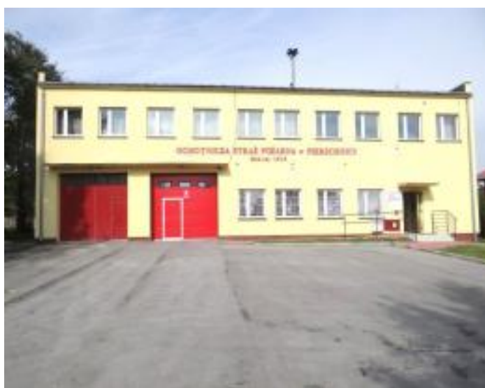
Wyremontowana Remiza w Pierzchnicy wraz z wyasfaltowanym placem manewrowym.