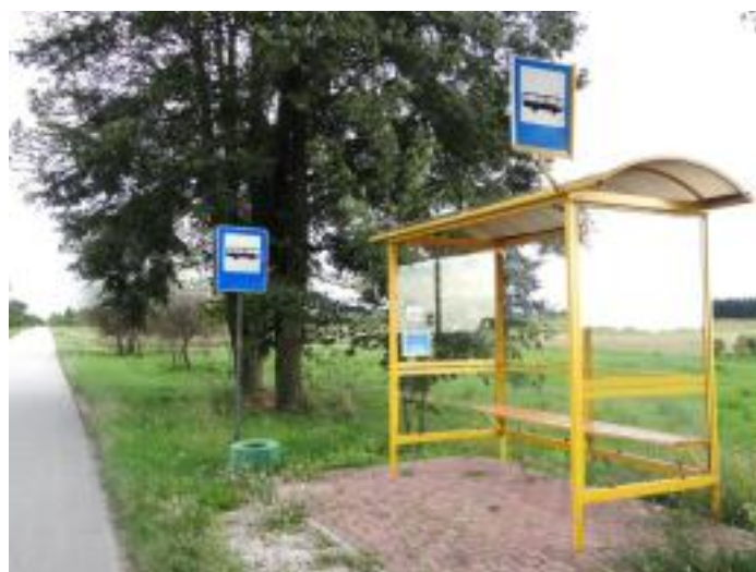
Zakupiono 8 nowych wiat przystankowych.