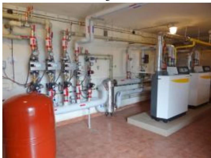
Nowoczesna kotłownia w Zespole Szkół w Pierzchnicy.