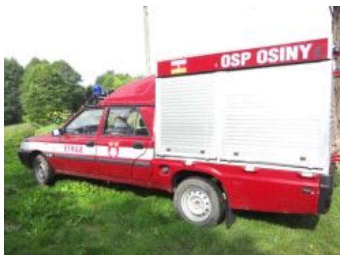
Przekazano samochód dla OSP Osiny.

Sprzęt przeciwpożarowy, hydrauliczny oraz medyczny dla: