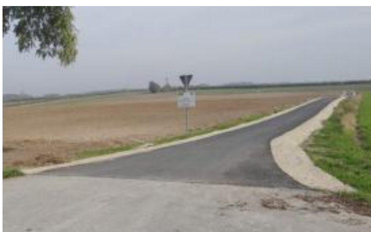
W Podlesiu wykonano nawierzchnię asfaltową w kierunku Chmielnika.