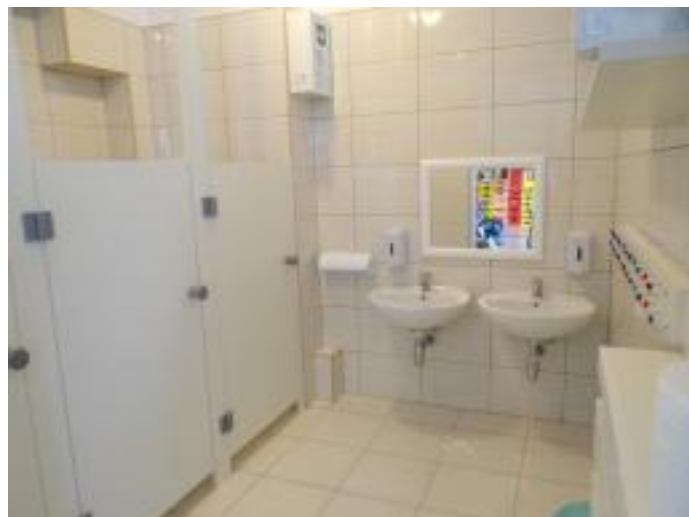
Zmodernizowano łazienki w przedszkolu w Pierzchnicy.