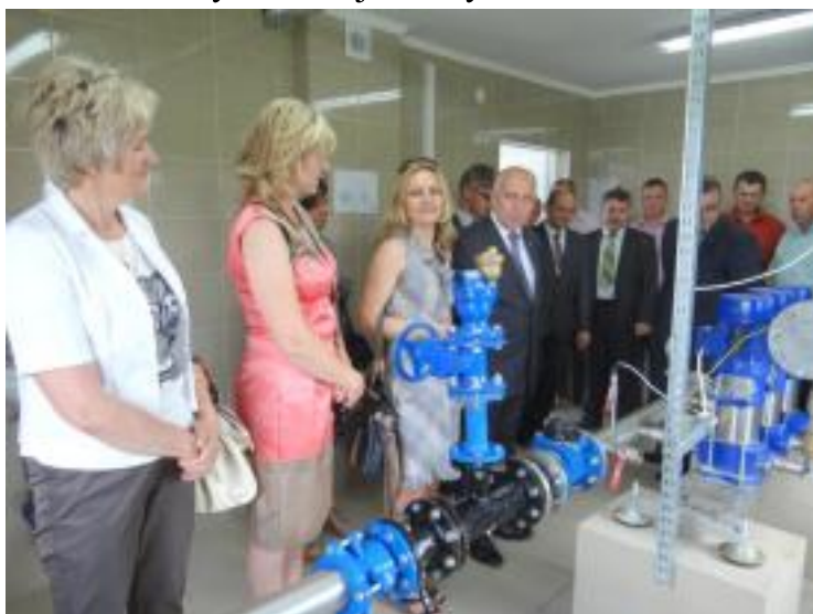
Zmodernizowane ujęcie wody w Pierzchniancie.