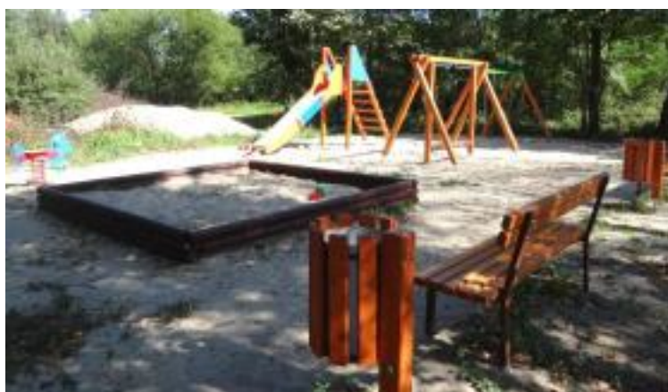
W Drugni Rządowej