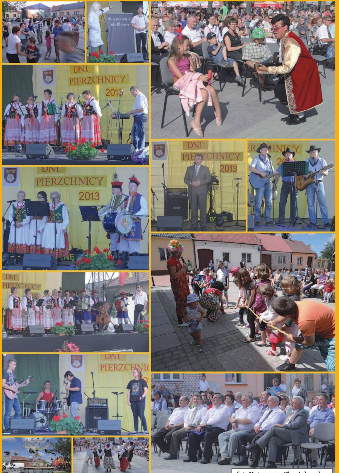
fot. Katarzyna Chmielewska