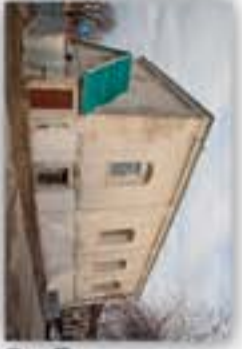
Synagoga w Ormieżniku