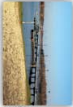
Zalew w Borkowie