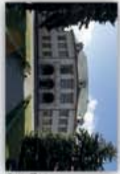
Muzeum Narodowe w Kiekach