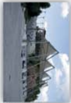
Kadzień w Kiekach