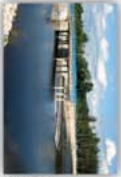
Zalew w Morawicy