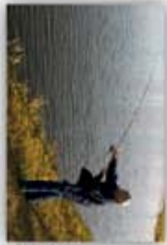
Zalew w Wojcieszowie