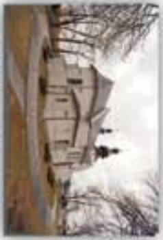
Kościół pw. św. Marii w Lświe