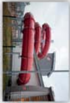
Przebiegi w Morawicy