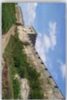
Mury obronne Szydłow