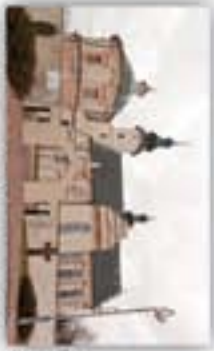
Sanktuarium Matki Bożej Loretańskiej w Piotrkowicach