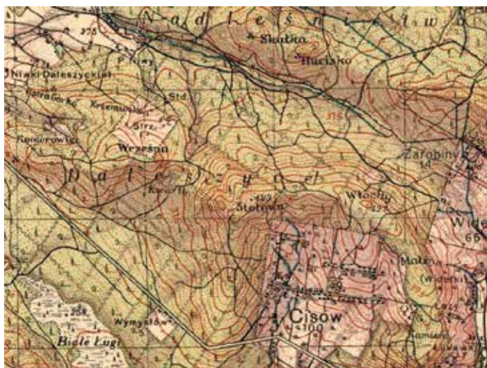
Mapa obozowiska oddziału „Wybranieckich” w lasach Cisowskich, w okolicy góry Września (najpierw przy „Strzelnicy”, później na przełęczy „Kwarty”).