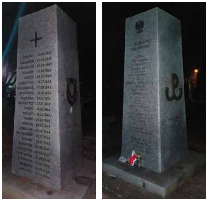
Pomnik ku pamięci żołnierzy AK „Wybranieccy” na Cmentarzu Partyzanckim w Kielcach. Na jednej ze stron pomnika wyszczególnione miejsca i daty akcji oddziału. Niestety z błędną datą akcji pod Maleszową, która w miała miejsce 3.IX.1943 r.