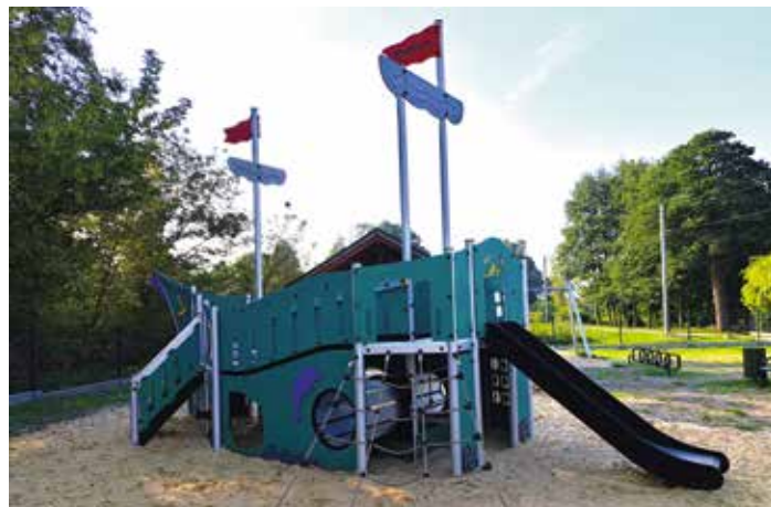
Plac zabaw Maleszowa

5. Parking przy szkole w Drugni. W okresie wakacji wykonano modernizację parkingu przy szkole w Drugni.