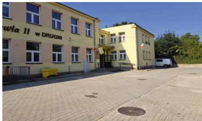
Parking przy szkole w Drugni

5. Parking przy szkole w Drugni. W okresie wakacji wykonano modernizację parkingu przy szkole w Drugni.