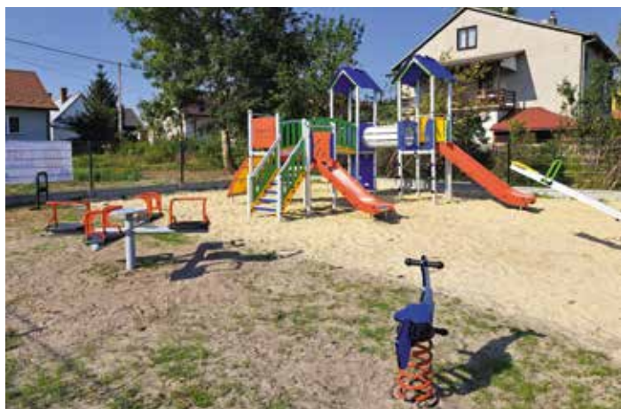
Plac zabaw Pierzchnianka