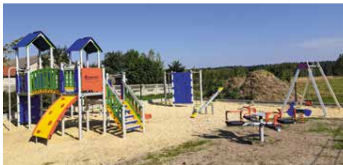
Plac zabaw Pierzchnianka