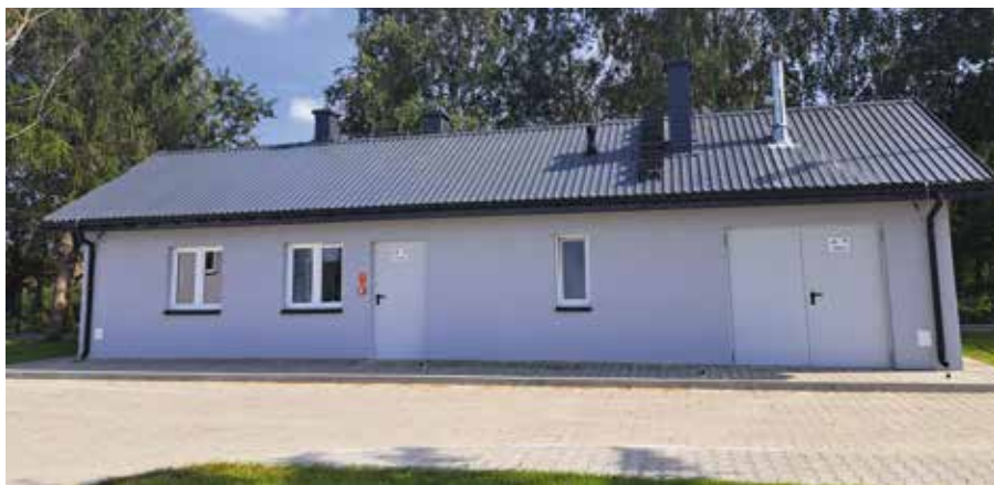
Budynek socjalny - oczyszczalnia ścieków

6. Modernizacja gminnej oczyszczalni ścieków w Pierzchnicy – etap III. W ramach tego etapu wybudowano budynek socjalny, nową przepompownię ścieków z nową kratą oraz zestaw sitopiaskownika w budynku głównym. Wartość inwestycji to kwota 1 mln 400 tys. zł. Środki pochodziły z dotacji unijnej w ramach PROW 2014-2020 oraz z funduszu rządowego.