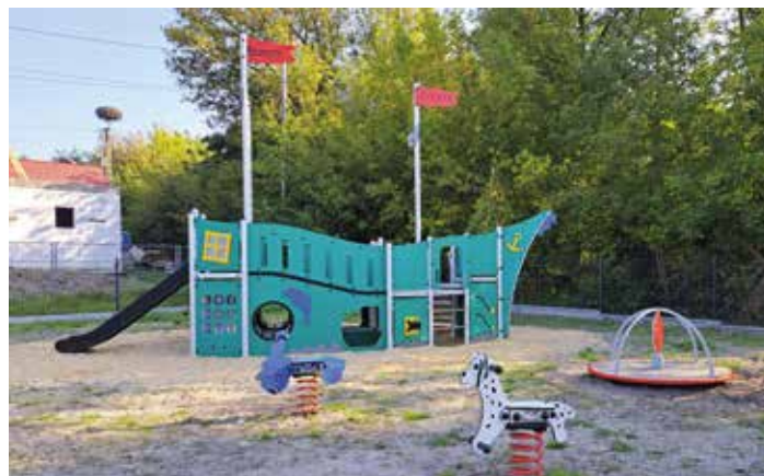
Plac zabaw Maleszowa