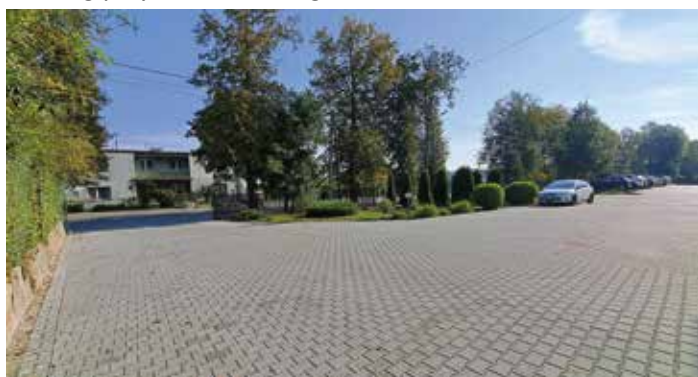
Parking przy szkole w Drugni