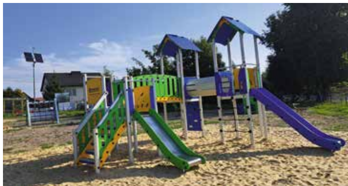
Plac zabaw Wierzbie

4. Plac zabaw. W sierpniu oddano do użytku nowe place zabaw w: Pierzchnianie, Wierzbii i Maleszowej. Wartość inwestycji to 380 tys. zł z tego dotacja z POLSKIEGO ŁADU 98%. W Pierzchnianie państwo Jadwiga i Zygmunt Łopatowscy nieodpłatnie użyczyli terenu pod plac zabaw.