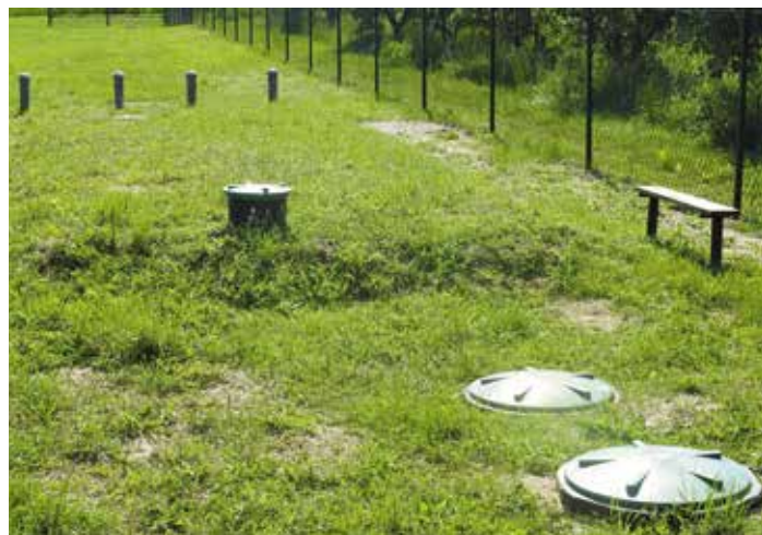
Przydomowa oczyszczalnia ścieków

2. Budowa przydomowych oczyszczalni ścieków. Pod koniec sierpnia zakończyła się budowa 82 szt przydomowych oczyszczalni ścieków. Wartość inwestycji to kwota 1 mln 568 tys. zł. Inwestycja dofinansowana ze środków unijnych z Urzędu Marszałkowskiego w ramach PROW 2014-2020.