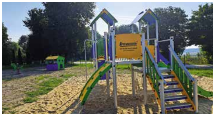
Plac zabaw Wierzbie