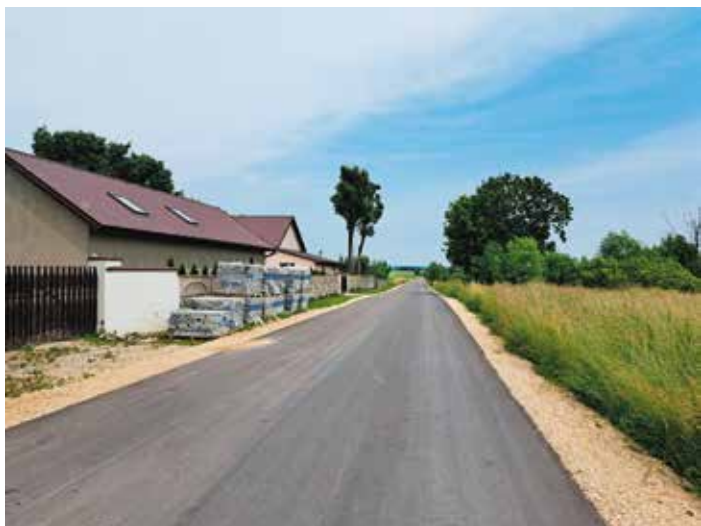
Droga Drugnia Rządowa - Podstoła