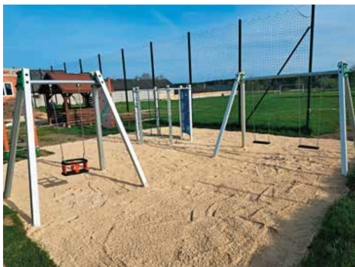
Plac zabaw - Ujny