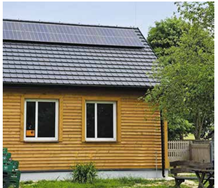
Modernizacja świetlicy w Podstole