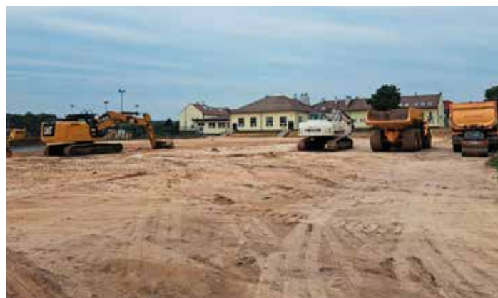
Kompleks boisk przy szkole w Pierzchnicy