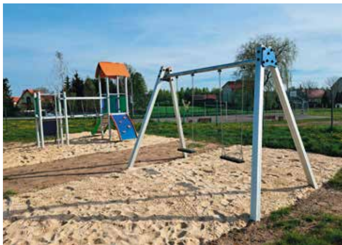
Plac zabaw - Pierzchnica

W ramach tego projektu na czterech placach zabaw tj. w Pierzchnicy na ul. Błońskiej, w Górkach, w Podlesiu i Ujnach wymieniliśmy najbardziej zniszczone zabawki. Wartość projektu to kwota 163 732,20zł - 100% finansowania ze środków unijnych w ramach Programu Rozwoju Obszarów Wiejskich na lata 2014 - 2020.