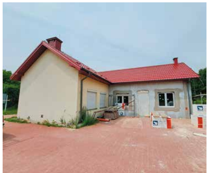
Rozbudowa świetlicy w Podlesiu