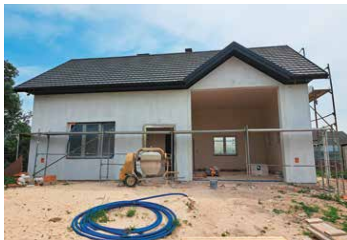
Budowa remizy dla OSP w Osinach