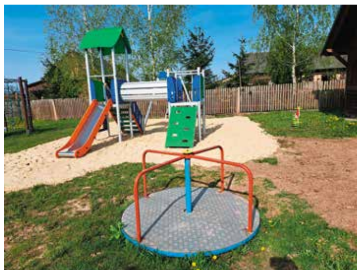
Plac zabaw - Górki