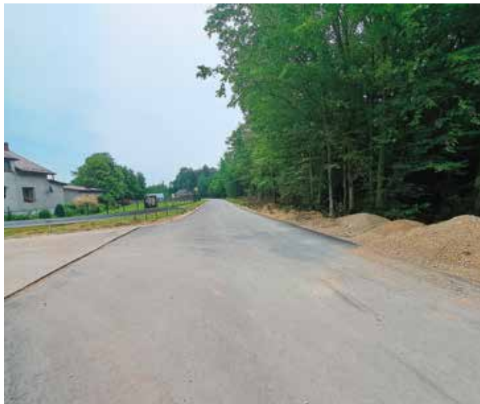
Droga Osiny - Lizawy