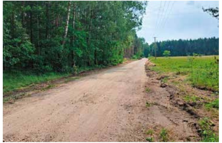
Droga przez Czarną - twają prace ziemne