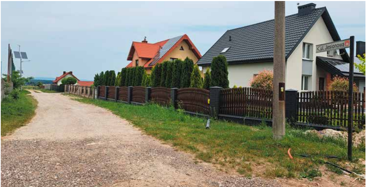
Pierzchnica ulica Jesionowa - trwają prace