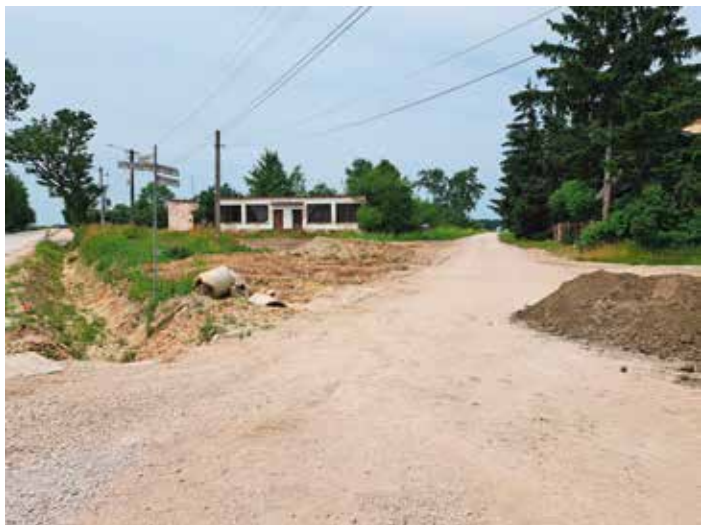
Droga Drugnia Rządowa - wkrótce rozpoczęcie robót

Realizowana jest modernizacja lub budowa dziewięciu odcinków dróg gminnych o łącznej długości ponad 6 km. Wartość inwestycji to kwota blisko 5 mln zł. Dofinansowanie rządowe z POLSKIEGO ŁADU 3 mln 800 tys.zł. oraz z Funduszu Dróg Samorządowych blisko 900 tys.zł.