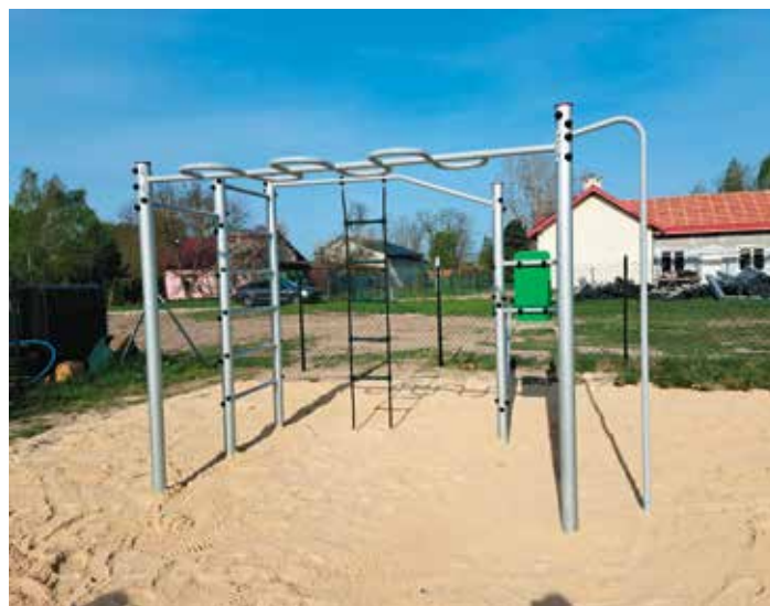
Plac zabaw - Podlesie

Stowarzyszenie Oświatowo - Wychowawcze w Pierzchnicy podjęło się tego przedsięwzięcia i z pomocą pracowników Urzędu Miasta i Gminy Pierzchnica, realizujemy projekt pn. „Modernizacja istniejących placów zabaw na terenie Gminy Pierzchnica”.