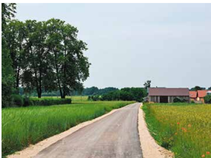
Droga Podstoła Parcela