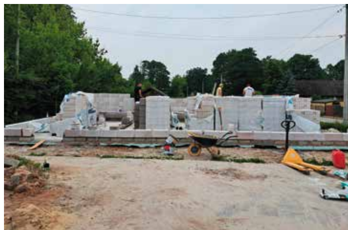
Garaż OSP Maleszowa