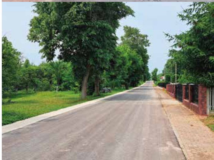
Droga przez Wierzbie