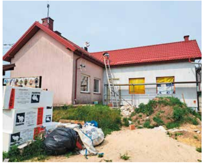
Rozbudowa świetlicy w Ujnach