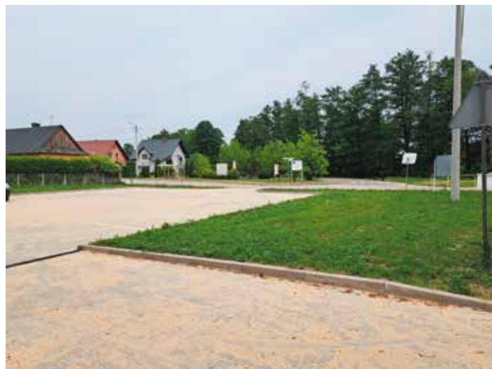
Zagospodarowanie centrum wsi Skrzelczyce