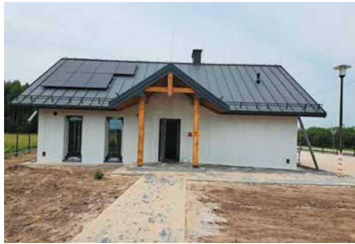
Budowa świetlicy w Strasznowie Gumienickim